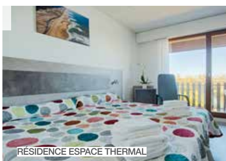
RÉSIDENCE ESPACE THERMAL

Une cure dans une ville d'art et d'histoire. Vestiges antiques, centre ancien, maisons basco-landaises, architecture Art déco, patrimoine thermal, culturel et naturel... Le territoire dacquois bénéficie de nombreux atouts patrimoniaux. Que dire de son marché pittoresque, occasion de goûter à toutes les saveurs des Landes. Chambre, appartement, studio ou camping, le groupe Thermes Adour offre un large choix d'hébergement et d'ambiance. Bien sûr, l'ensemble des professionnels suivent le protocole sanitaire strict pour un séjour serein.