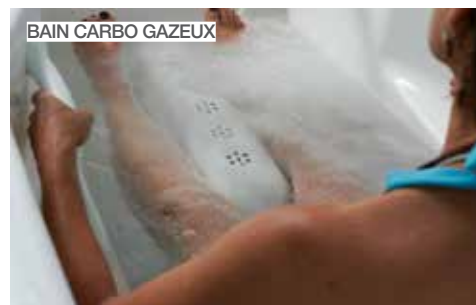
BAIN CARBO GAZEUX