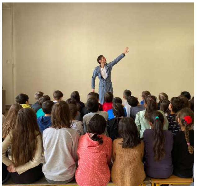
"Jon" du Théâtre du Lyon, avril 2022

Accueillez dans votre structure ou votre établissement scolaire (école, collège, lycée) le spectacle "Jon" d'après "Jonathan Livingston le Goéland" de Richard Bach.