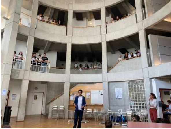
Projet "Frontière" poésie et mise en voix à l'Institution Robin - Lycée Ste Colombe