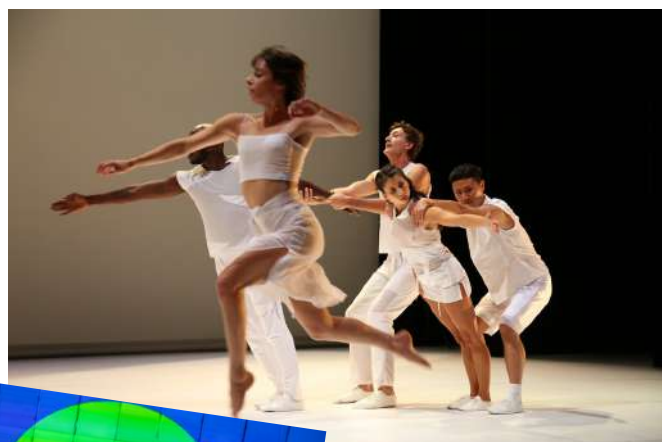
Ulysse © Guy Delahaye