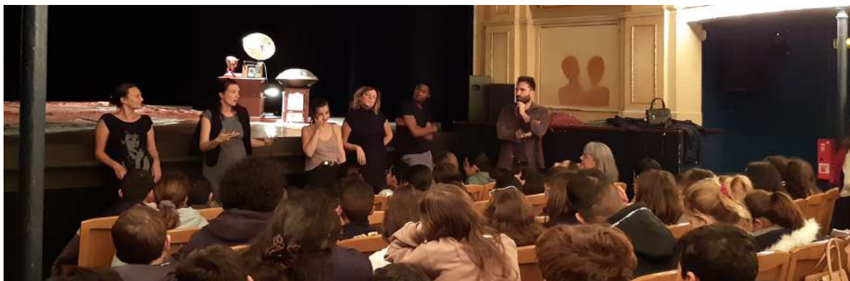
Bord plateau après la représentation de "Longtemps la nuit" de la Cie Qui Porte Quoi ?