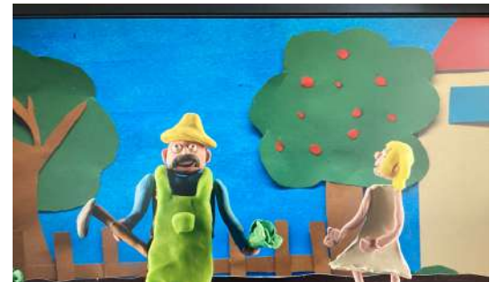
Projet "Petit Cinéma de Classe" à l'école Paul Vincensini de Reventin Vaugris