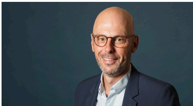
Thomas Snégaroff