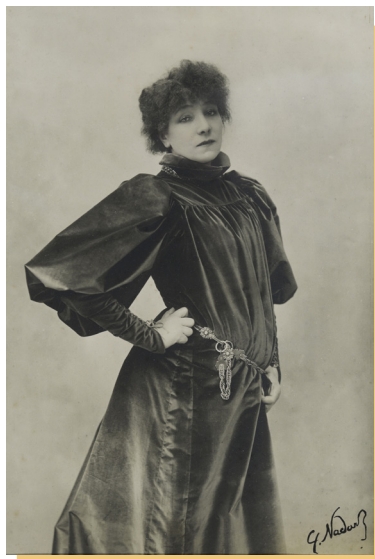
Paul Nadar, Sarah Bernhardt à la ville, en costume de velours, photographie, 41 x 32 cm, 1894