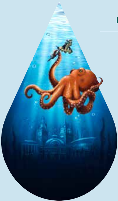
Affiche ÉvianTattoo Show 2023, by Wendy Racana