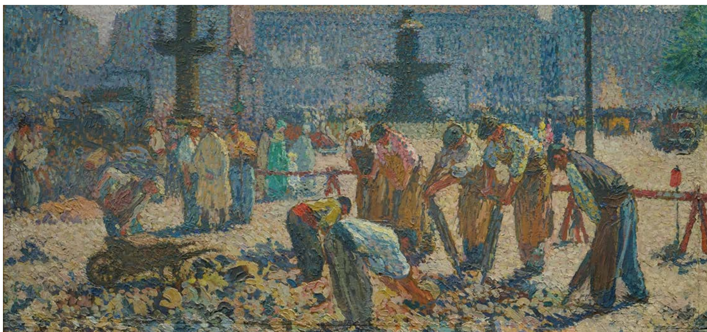
Henri Martin, Les Poveurs, vers 1925.