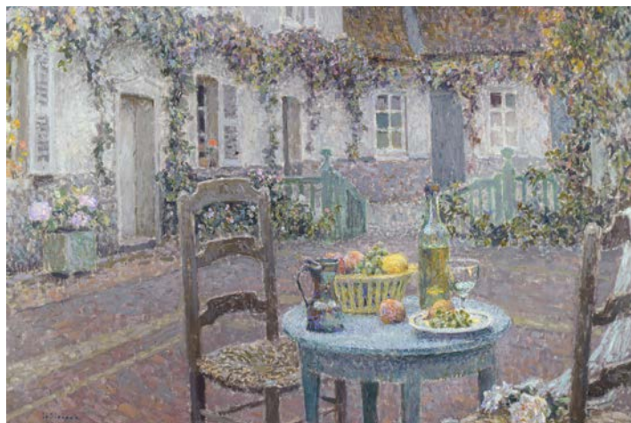
Henri Le Sidaner, La Table bleue , Gerberoy, 1923.