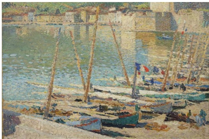
Henri Martin, Collioure . Coll. part.