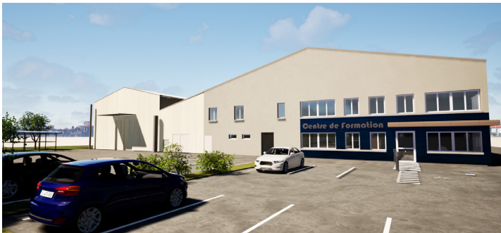
Futur centre de formation