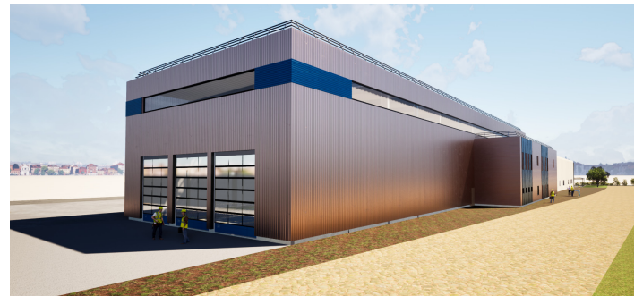
Atelier de maintenance mutualisé

Implanté à Saint-Pierre-des-Corps, au cœur du principal hub ferroviaire de la région Centre-Val de Loire, MECATEAM WORKSHOP répond à une double exigence : accompagner la croissance des besoins en maintenance des engins de travaux ferroviaires et structurer une offre de formation adaptée aux attentes des entreprises régionales.