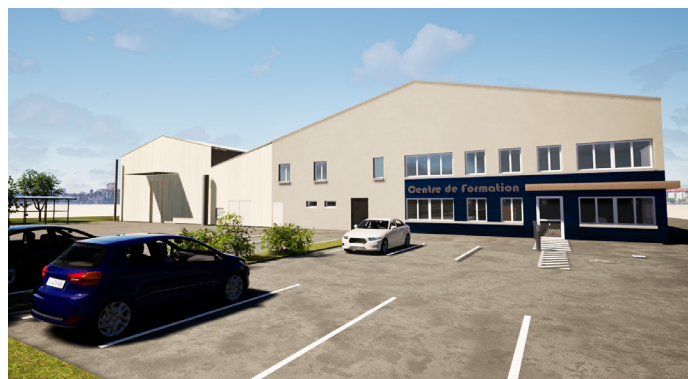
Futurs locaux de Campus Mecateam à Saint-Pierre-des-Corps (37)

Campus Mecateam franchira une nouvelle étape de son développement avec l'ouverture, fin 2026, d'une antenne à Saint-Pierre-des-Corps, près de Tours. Cette implantation en Centre-Val de Loire est le résultat de la présence sur le terrain depuis bientôt trois ans de MECATEAMCLUSTER. Elle marque une nouvelle étape dans le déploiement national de Campus Mecateam.