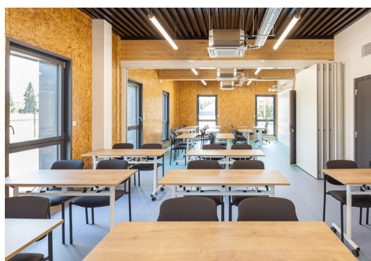
La location des espaces de la plateforme Mecateam est gérée par Campus Mecateam