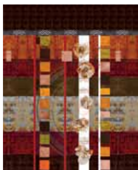
Toile L'écume des jours de Luciano di Concetto

1/ Robe tunique Toute la Vie, 129 euros 2/ Veste Leila, Degré7, 385 euros 3/ Echarpe, Aventures des Toiles, 49 euros 4/ Gants, Aventures des Toiles, 55 euros 5/ Sac à main, Aventures des Toiles, 135 euros