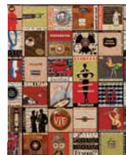
Toile Toute la vie d'Aurélia Chapelain