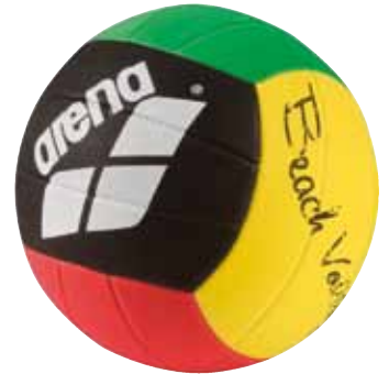
Ballon de beachvolley

En cette année 2010 de Coupe du Monde de Football, Arena adresse un clin d'œil aux supporters du ballon rond avec une mini-ligne aux couleurs de l'événement qui se déroulera en Afrique du Sud. La marque est d'ailleurs partenaire de la fédération de natation du pays hôte de la Coupe. Evidemment, chez Arena, on ne joue pas au foot mais au beach-volley. Mais il y aura tout ce qu'il faut pour célébrer dignement ce rendez-vous planétaire sur la plage bien entendu ! Parce que cette année, la Coupe promet d'être festive et haute en couleurs.