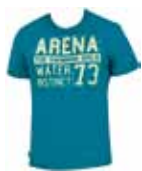
Tee-shirt Cordova : back to the 70's Ref 37575

Longueur : 12 cm Matière : Waterfeel (80% polyamide/20% élasthanne) Taille : 75-110 Coloris : anthracite/orange ; gris clair/anthracite. PPI : 25 euros