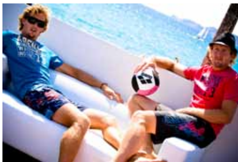
Les frères Cès à la pause entre deux smashes

Longueur : 50,5 cm Matière : microfibre toucher peau de pêche Taille : XS-XXL Coloris : blanc, fuchsia et turquoise sur gris anthracite ou blanc, orange et anthracite sur gris clair. PPI : 43 euros