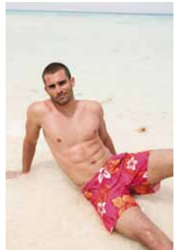
Boxershorts Berna en framboise