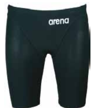
Le cycliste PowerskinXP

Ces trois technologies ont été validées par la FINA (Fédération Internationale de Natation)