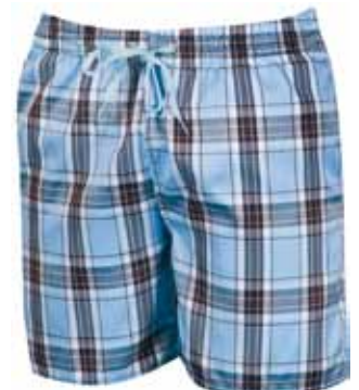
Boxershort Bricky en bleu azur

Longueur : 27 cm Matière : monoélastique (coton/polyester/nylon avec 3 % d'élasthanne). Taille : 75-110 Coloris : noir. PPI : 42 euros