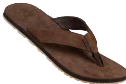
Tongs Prince en nubuck