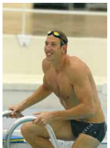
Alain Bernard avec le maillot de bain Sigor

Large choix de couleurs : argent, noir, marine, mais aussi blanc/turquoise, rouge/vert et pourquoi pas framboise. Pointure : 36 à 47 PPI : 25 euros