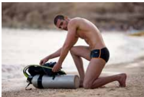
Slip Sophocle : espion sexy Ref 16343

Née en 1973, Arena rend hommage à ses origines avec une ligne masculine très seventies. Au programme : tee-shirt coupé très près du corps avec grands marquages façon universités américaines et maillots qui jouent à fond le style graphique de l'époque dans des coloramas super funs.